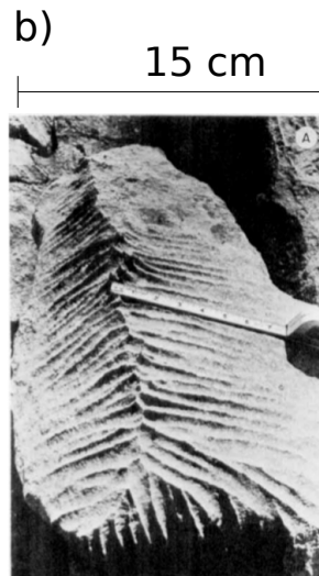
Calcaire (Alberta). (Glew and Ford, 1980)