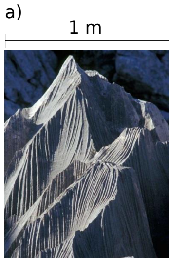
Calcaire (Slovénie).